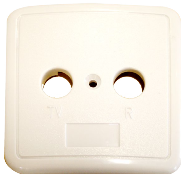
MTB Façade prise