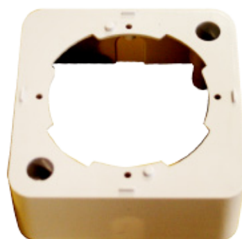
SSB Soporte superficie para toma