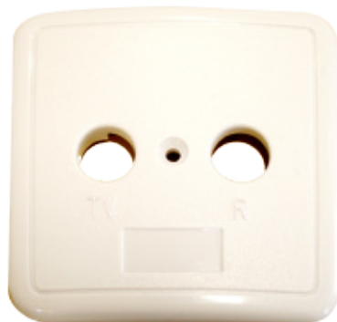
MTB Marco para toma