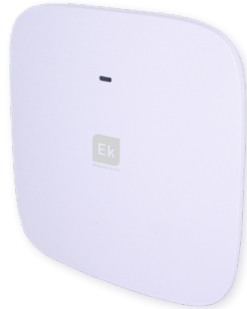
TR 750 TR 1200