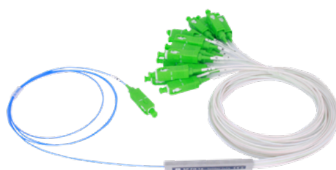
SP FO 16