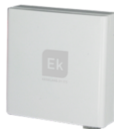
RT 1 A PTG