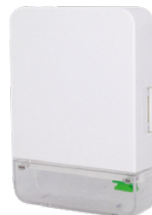
RT 1 A PT