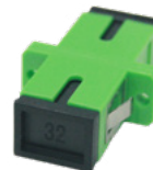
PRODUCTO OPCIONAL: A SCAPC S (363001) ADAPTADOR SC/APC COMPATIBLE CON RP FO