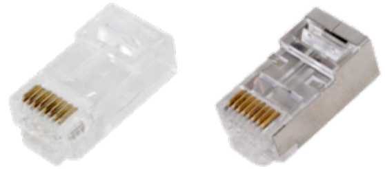
RJ45 UC6A · RJ45 FC6A

✓ Reduz os potenciais erros de instalação, fornecendo uma garantia de certificação