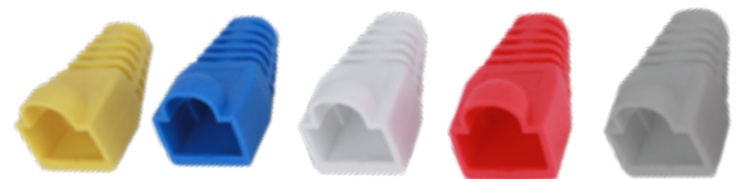
CRJ45 · CRJ45Y · CRJ45R · CRJ45B · CRJ45G