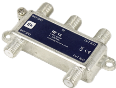
RF 13 / RF 14