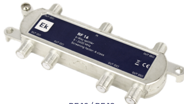
RF 16 / RF 18