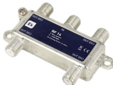
RF 13 · RF 14