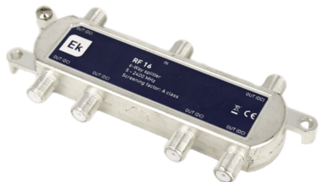
RF 16 · RF 18