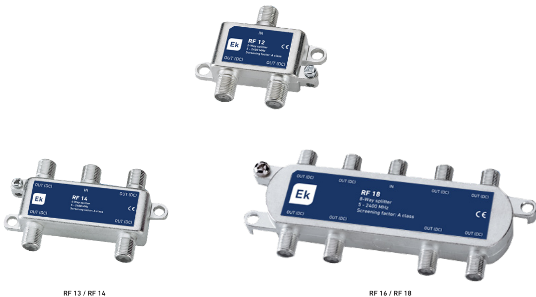
RF 13 / RF 14