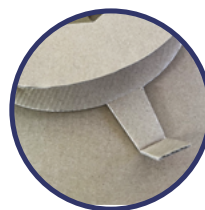
Aletas integradas en la bobina