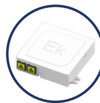
Detalle de roseta con adaptadores SC/APC antipolvo