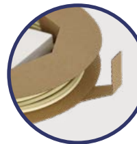
Aletas integradas en la bobina