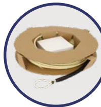
Bobina de cartón con sistema Ek ROLLER