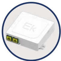
Detalle de roseta con adaptadores SC/APC antipolvo