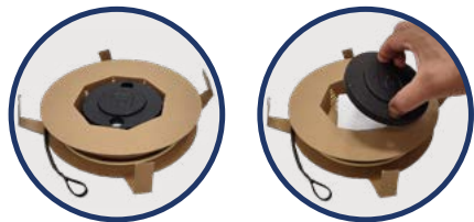
Ek ROLLER + con accesorio especial para facilitar el desenrollado