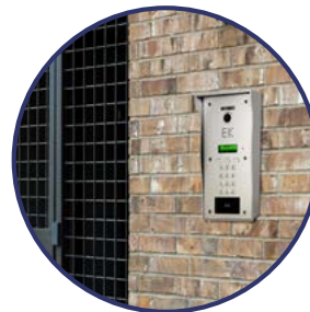
INSTALACIÓN EN SUPERFICIE