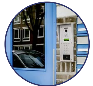
INSTALACIÓN EN CAJA DE EMPOTRAR