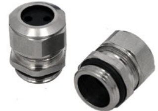
2FPG11 (Para ON 129 AC)