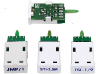
JMP -1 / STI-3.5 / TSI-1/9