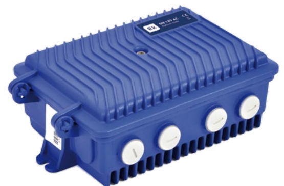
ON 129 AC