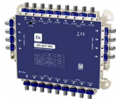
MS QCF 989