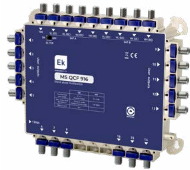
MS QCF 916