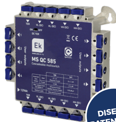
MS QC 585