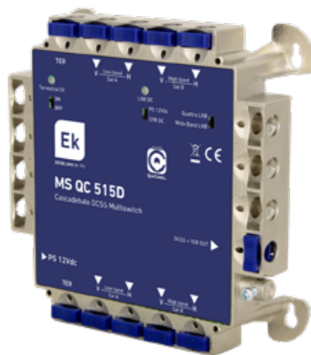
MS QC 515D