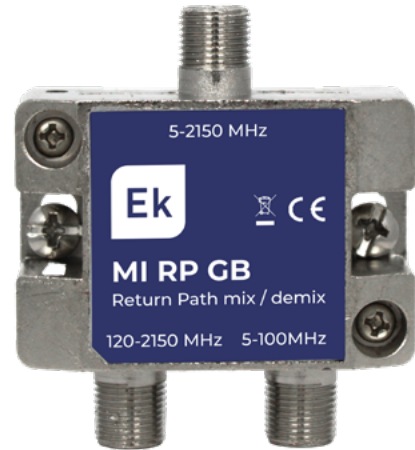
MI RP GB