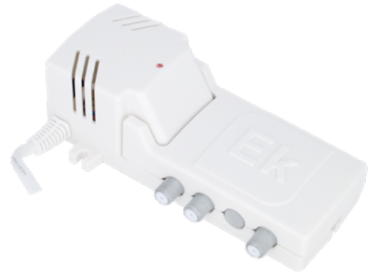
MAD 382 L2