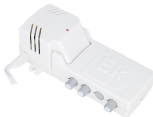
MAD 382 L