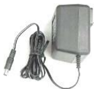
Fuente de alimentación X2