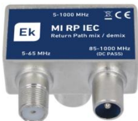
MI RP IEC X2