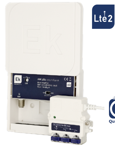
KIT AM 361