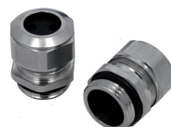
2FPG11 (Para ON 129 AC)