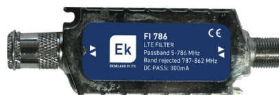
FI 778 / FI 786