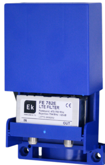
FE 782 E