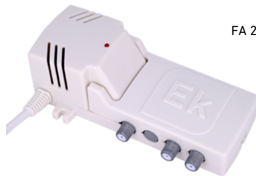
FA 242 / FA 121