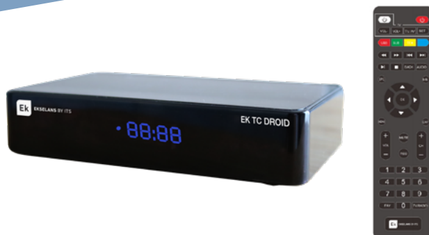
EK TC DROID