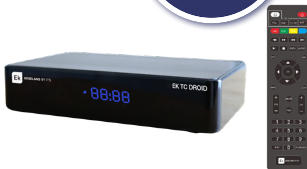
EK TC DROID