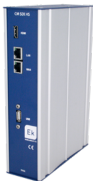
EK STREAM BASIC