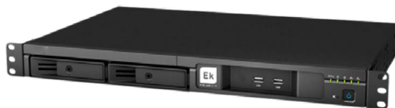
EK STREAM PLUS