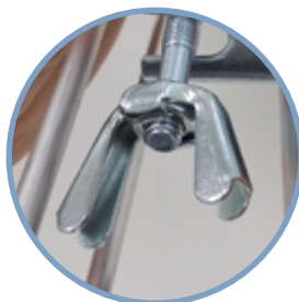
Dadi a farfalla