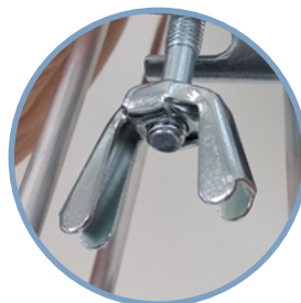
Large écrou type "papillon"