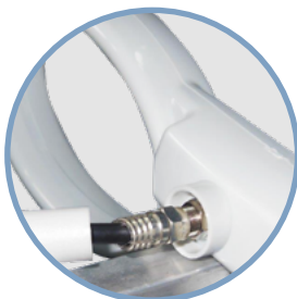
Dipôle compact actif / passif

Regarder ici tous les avantages de la solution Easy