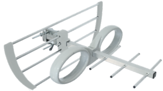
EK MINI AP