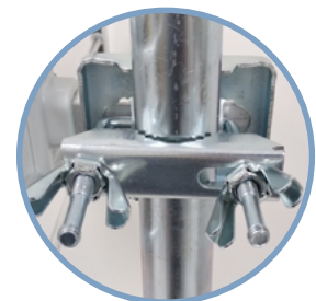
Système Easy U (brevet Ek)