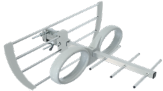
EK MINI AP