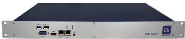
EK LINK R