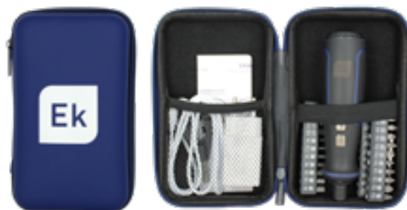
Custodia Ek DRIVER

porta batteria (la batteria al litio è inclusa)