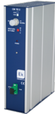
CM TO 3-1550