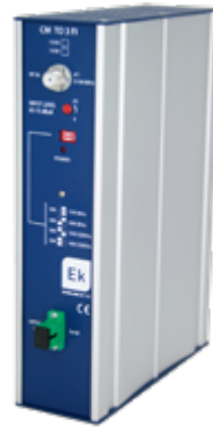
CM TO 3 FI-1310 CM TO 10 FI-1550