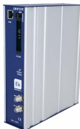
CM IP CI-TC