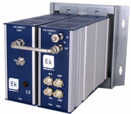
CM COMPACT PLUS 2S2