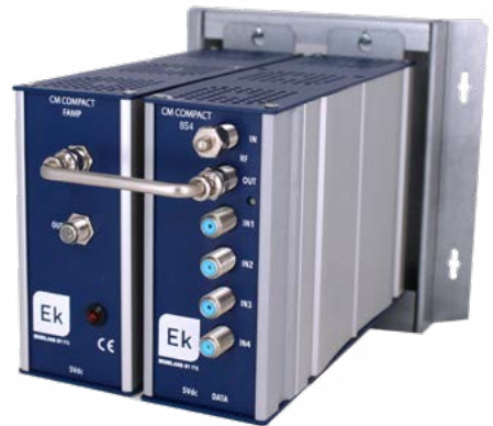
CM COMPACT PLUS 8S4 / 8S8