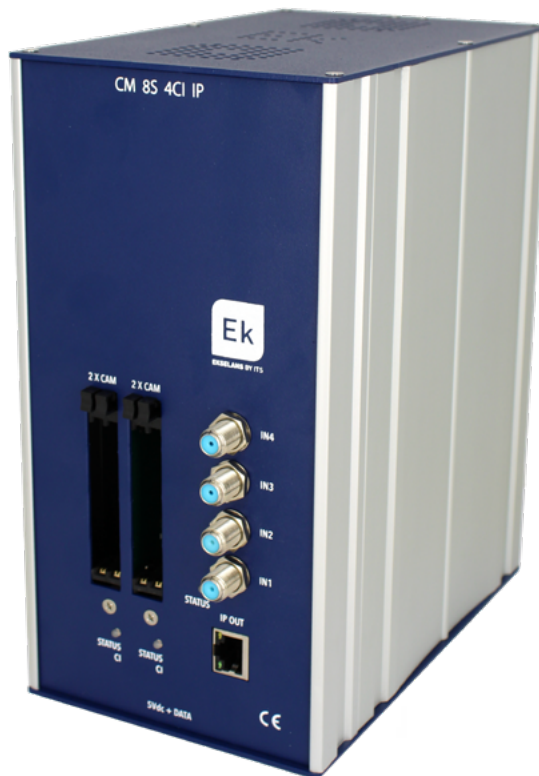
CM 8S 4CI-IP