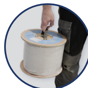
TOURET AVEC POIGNEE Ek ROLLER