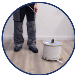
SOLUTION DE DEROULEMENT Ek ROLLER