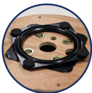
MECANISME Ek ROLLER