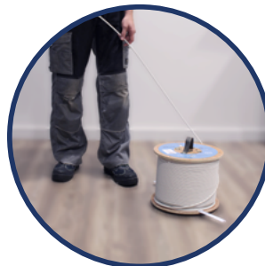
SOLUTION DE DEROULEMENT Ek ROLLER