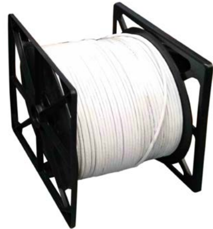
CLU 6 CUD