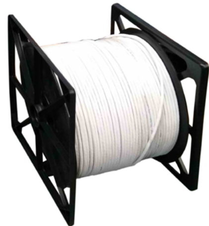
CLU 6 CUD