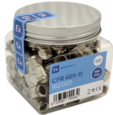
CFR 6 EK-B