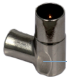
C95 M EK

Impugnatura ergonomica per facilitare la connessione