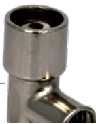
C95 H EK

Apertura conica per facilitare l'ingresso del cavo