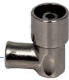
C95 H EK

Aboque cónico para facilitar la entrada de cable