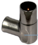
C95 M EK

Agarre ergonómico para facilitar la conexión