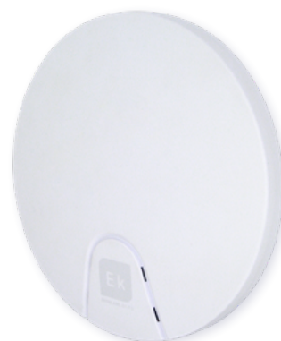
AP 300 LP