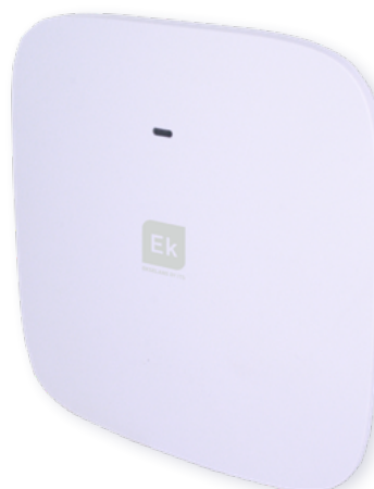
AP 750 NG AP 1200 W2