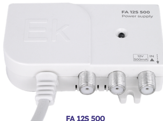
FA 12S 500