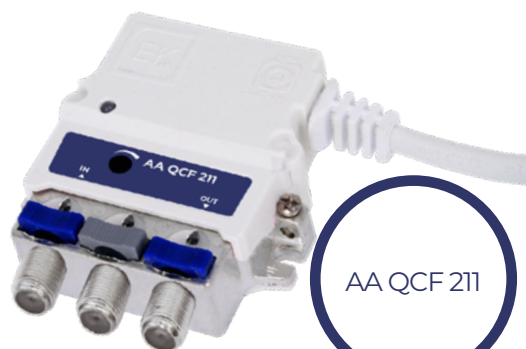
AA QCF 211