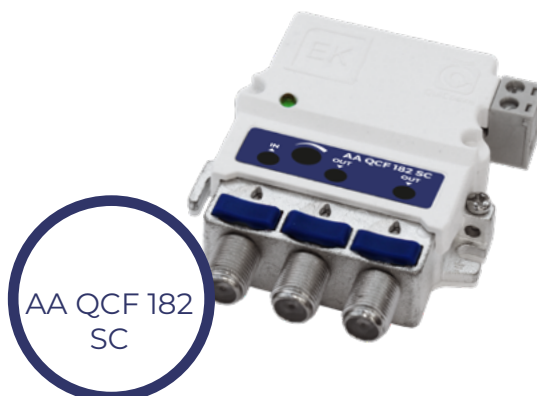
AA QCF 182 SC