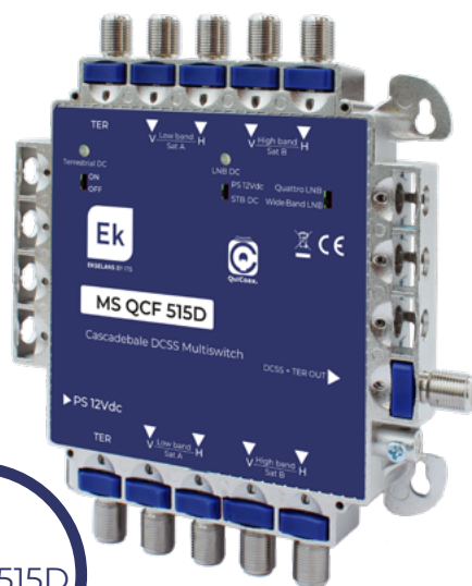
MS QC 515D