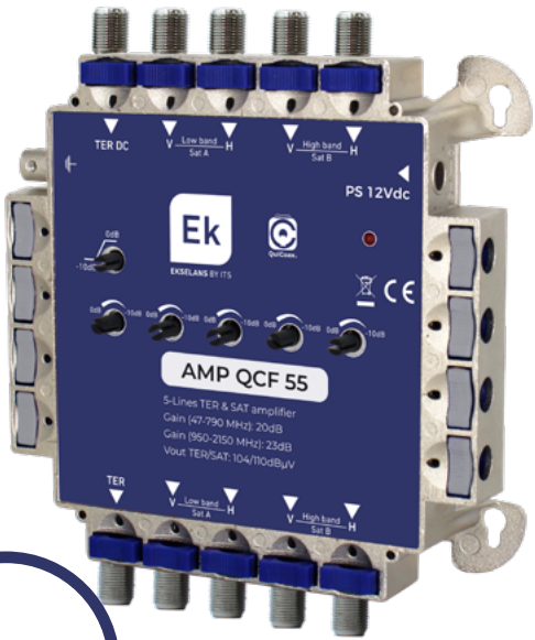
AMP QCF 55