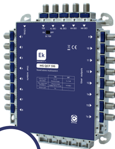
MS QCF 516