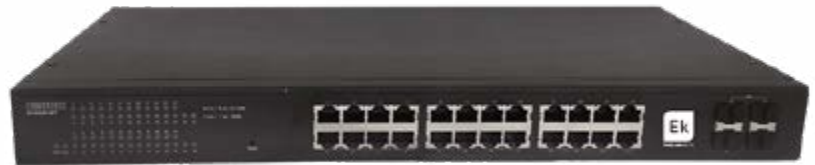
SWG 24 L2