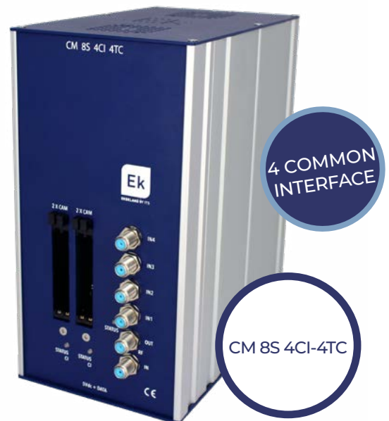
CM 8S 4CI-4TC