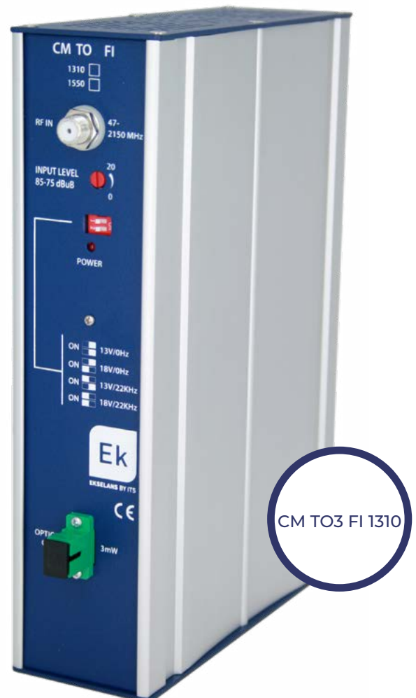
CM TO3 FI 1310