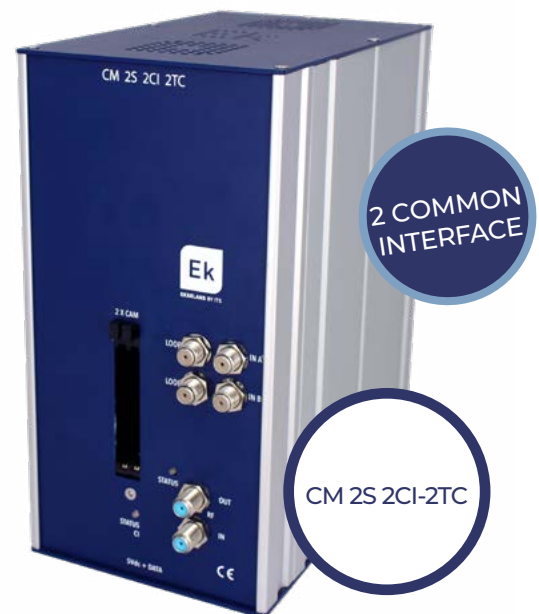
CM 2S 2CI-2TC