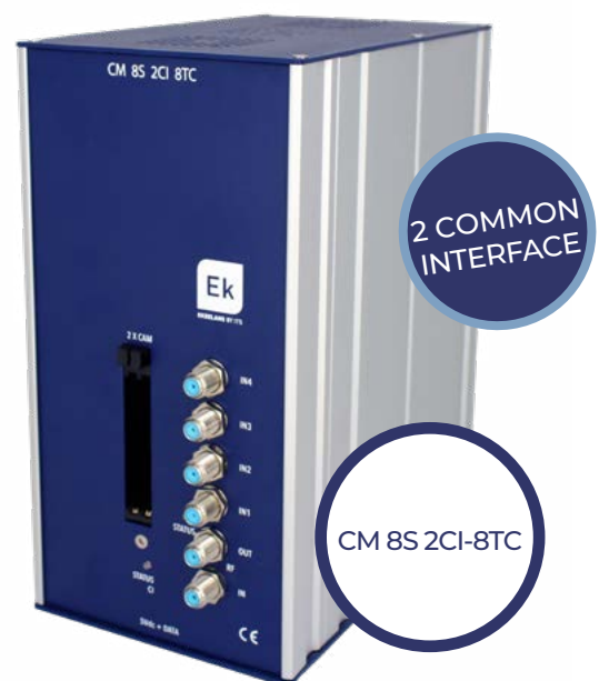
CM 8S 2CI-8TC